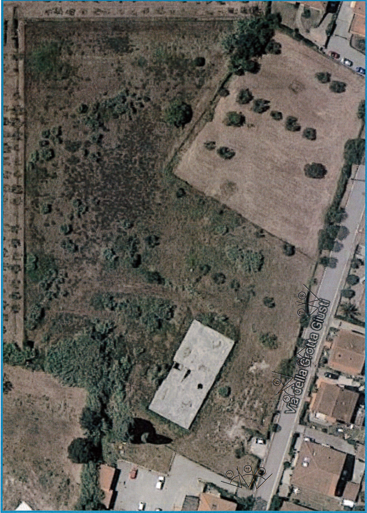
PLANIMETRIA GENERALE ORTOFOTO