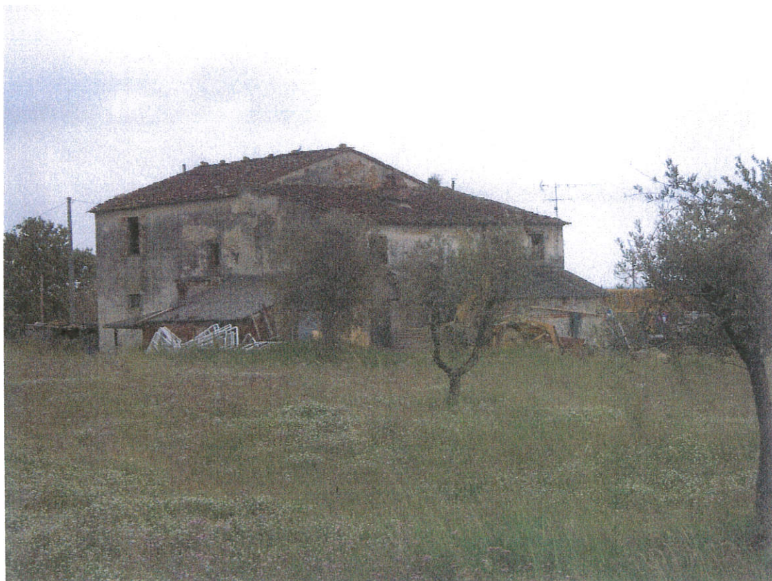
Punto di vista n. 2