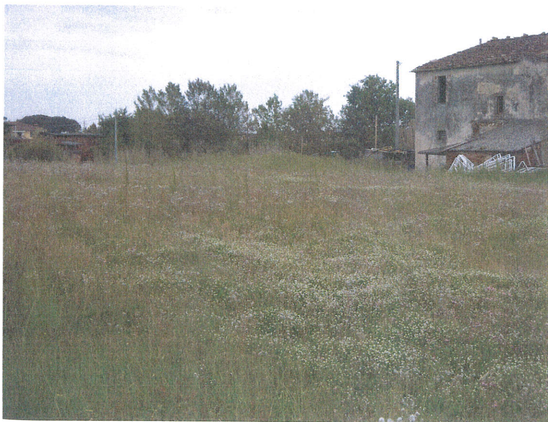
Punto di vista n. 4