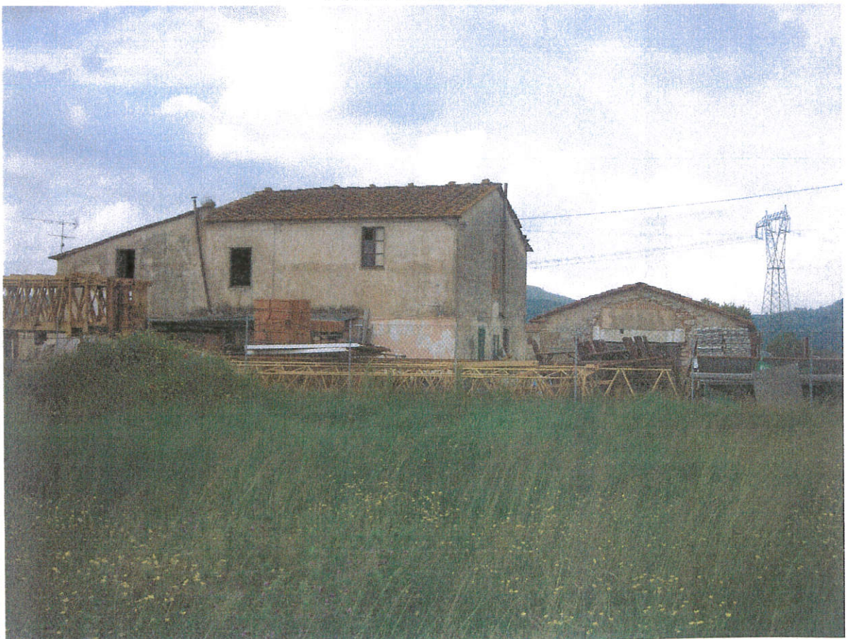
Punto di vista n. 6