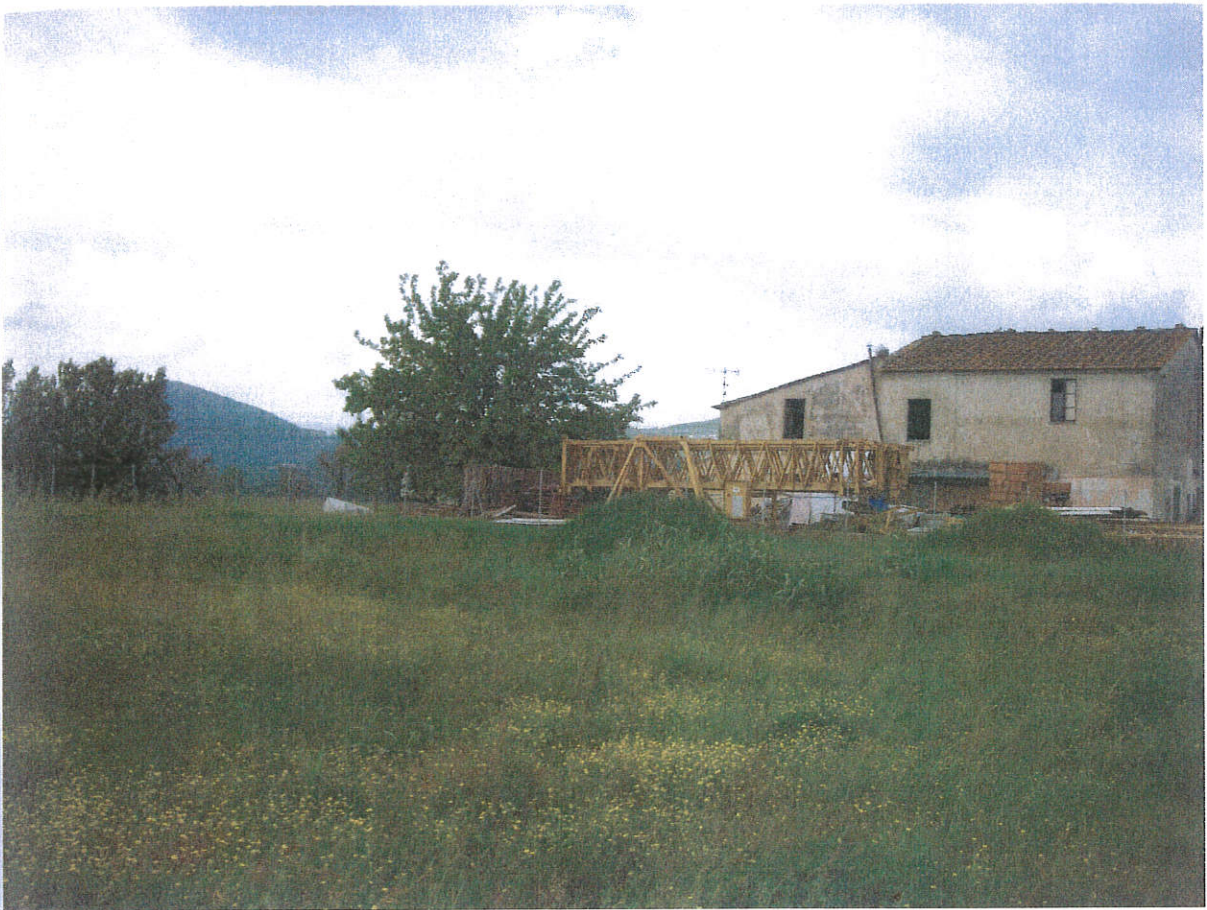
Punto di vista n. 5