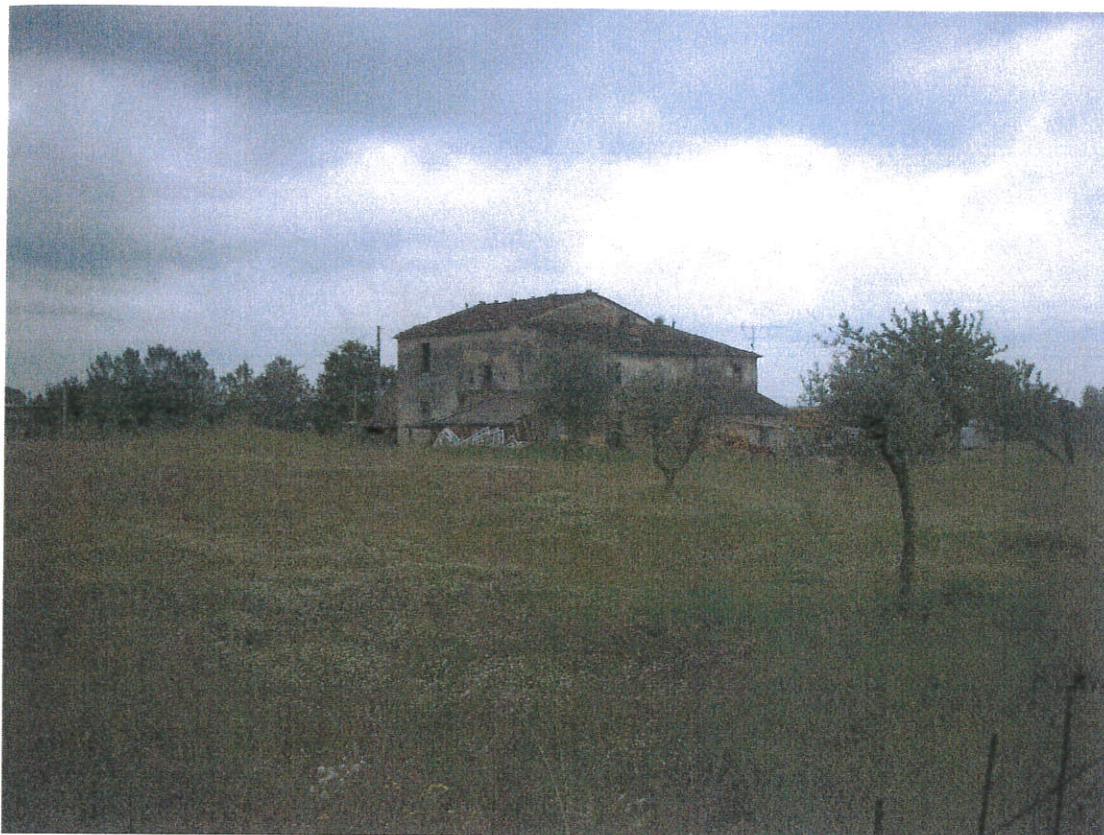
Punto di vista n. 3