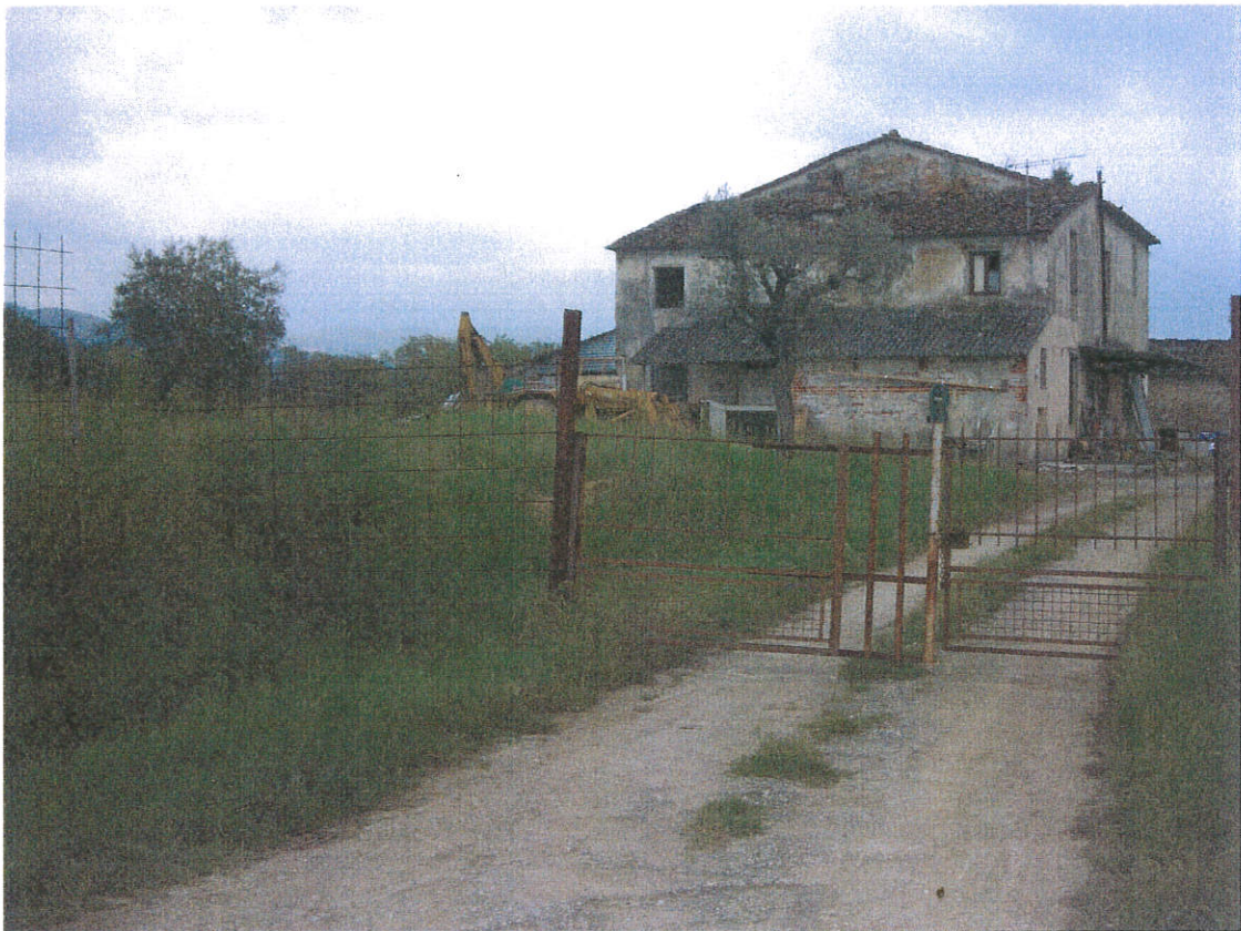
Punto di vista n. 1