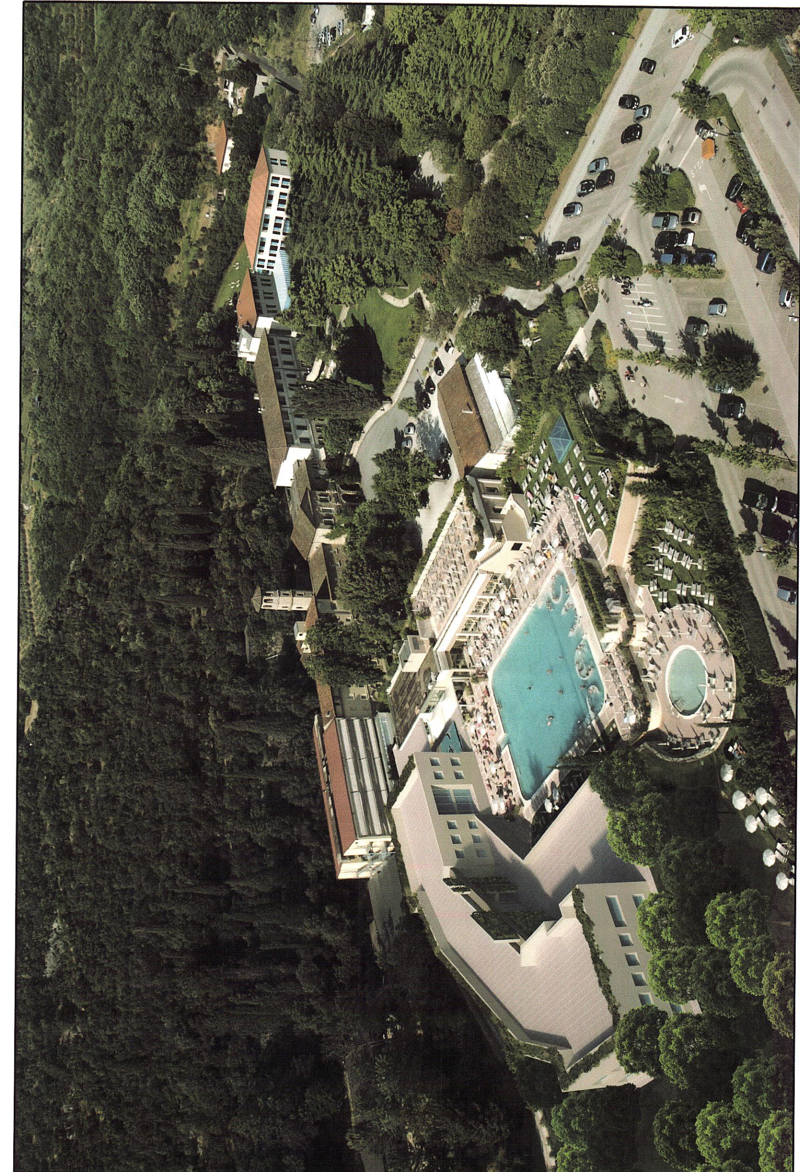
SITUAZIONE DI PROGETTO