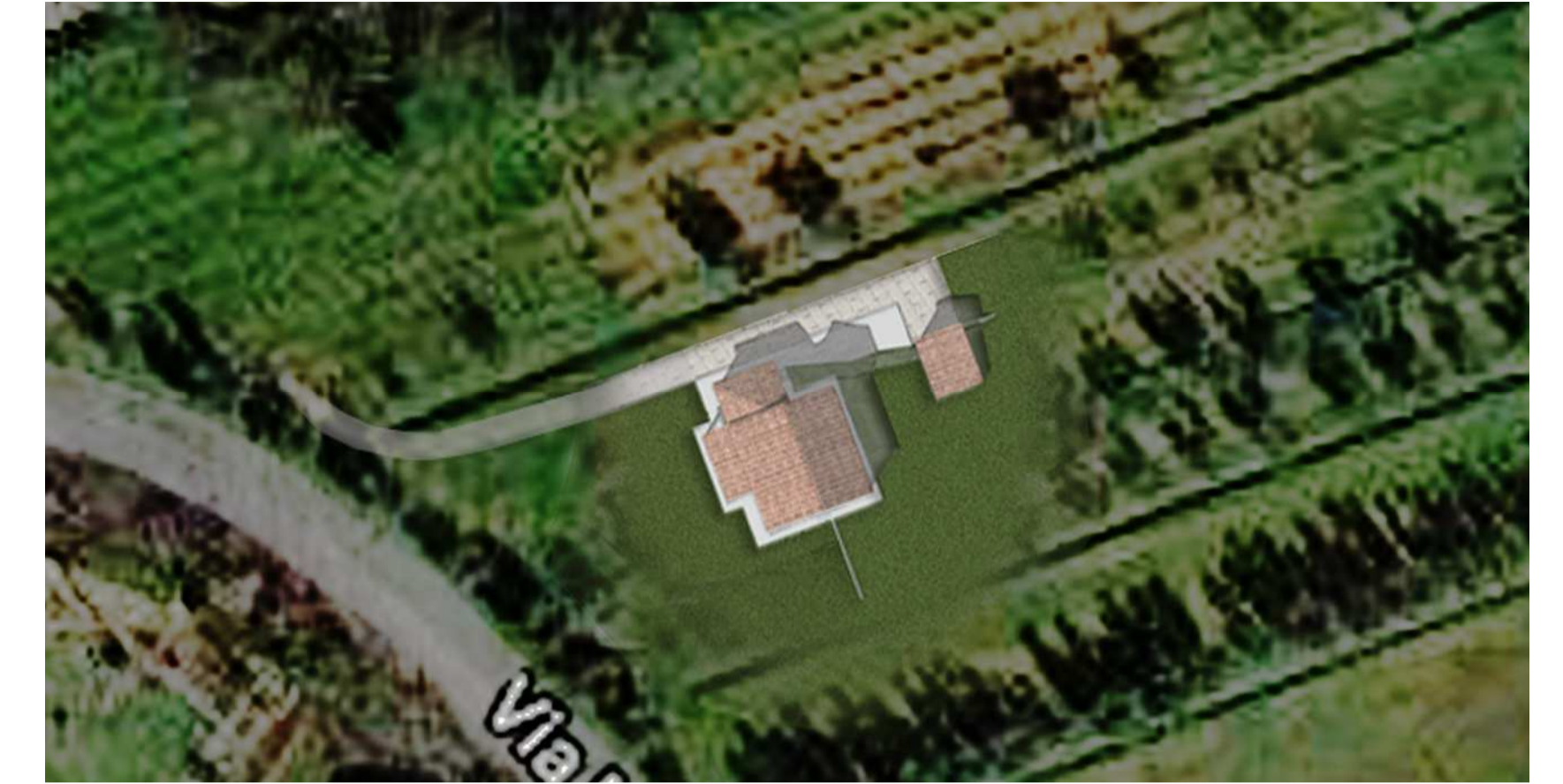
Planivolumetrico dell'intervento con inserimento ambientale.