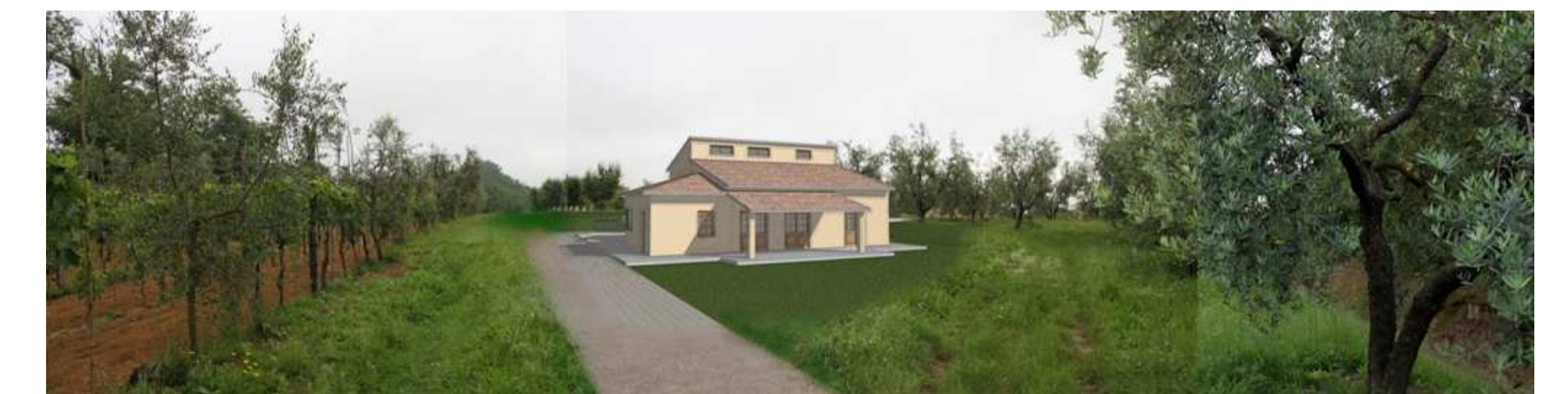
Fotoinserimenti rendering dell'intervento; la tipologia abitativa scelta mira a inserirsi in maniera armoniosa all'interno del contesto circostante, gli elementi rurali che caratterizzano l'area sono mantenuti e rispettati.