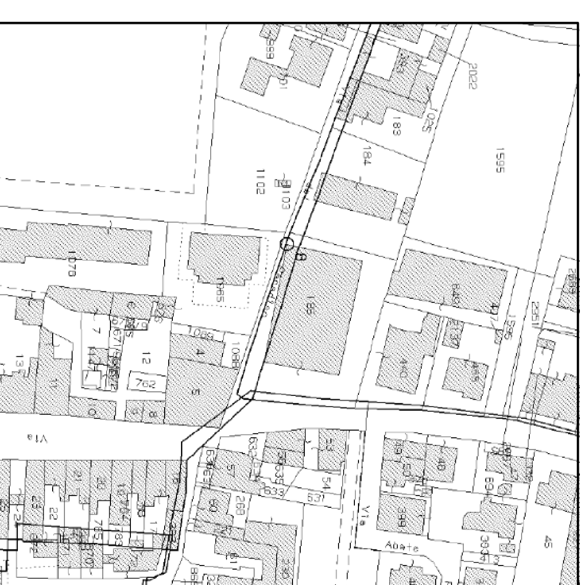
Estratto di Mappa Catastale Foglio n°5 Particelle 184-185