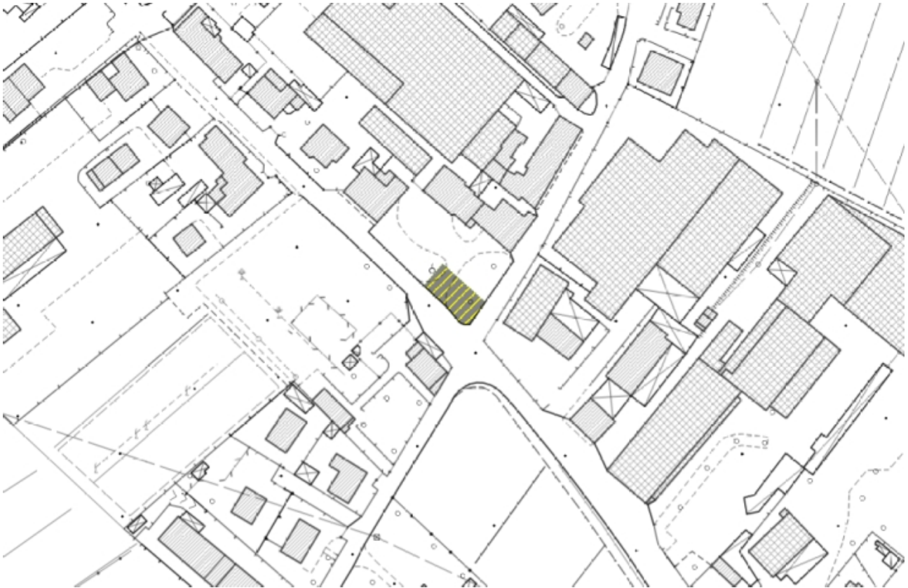
Estratto base cartografica – scala 1:2.000