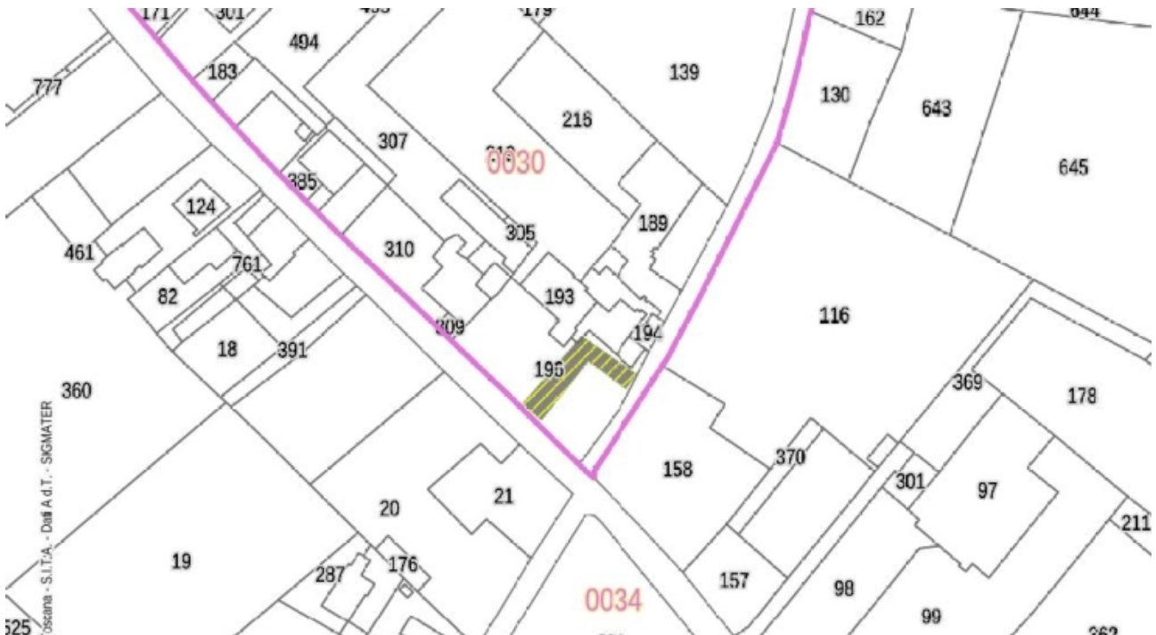
Estratto base catastale – scala 1:2.000