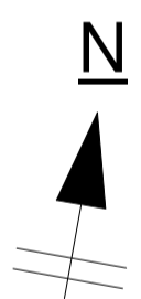
PLANIMETRIA LOTTO SCALA 1:500